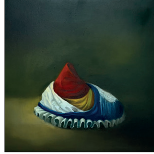
Elian Zinner ohne Titel, 2020 Öl auf Leinwand 50 x 50 cm CHF 900