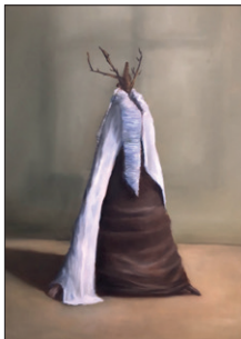
Elian Zinner ohne Titel, 2020 Öl auf Leinwand 70 x 60 cm CHF 1.500