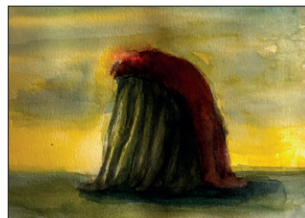
Elian Zinner ohne Titel, 2022 Aquarell auf Papier 25 x 30 cm CHF 300