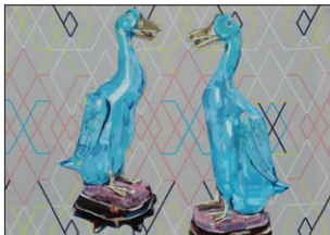
Tom Fellner Zwei Enten auf IKEA®, 2015 Acryl/Tempera/Öl auf bedrucktem Stoff 80 x 100 cm CHF 5.000