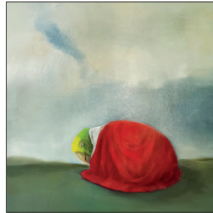
Elian Zinner ohne Titel, 2021 Öl auf Leinwand 60 x 60 cm CHF 1.200