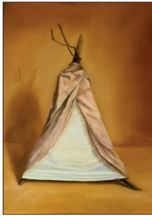
Elian Zinner ohne Titel, 2020 Öl auf Leinwand 80 x 70 cm CHF 1.500