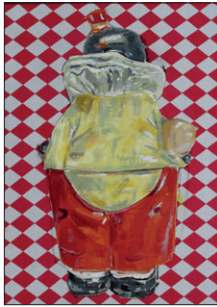
Tom Fellner Clown-Abschied, 2016 Acryl/Tempera/Öl auf bedrucktem Stoff 74 x 65 cm CHF 4.500