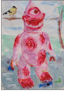
Tom Fellner Monster Drawing 93 (Spring 2), 2013 Bleistift/Wasserfarbe/Gouache auf Papier 27,5 x 18,5 cm CHF 1.900 (gerahmt)