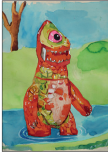
Tom Fellner Monster Drawing 31 (Spring Monster), 2011 Bleistift/Wasserfarbe/Gouache auf Papier 35 x 28 cm CHF 1.800 (gerahmt)