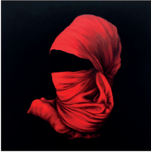
Elian Zinner Kopftuch IV/20, 2020 Öl auf Leinwand 100 x 100 cm CHF 3.500