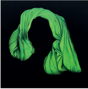
Elian Zinner Kopftuch III/20, 2020 Öl auf Leinwand 100 x 100 cm CHF 3.500