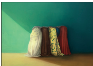
Elian Zinner Wischiwuschis, 2021 Öl auf Leinwand 60 x 80 cm CHF 1.200