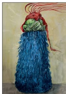
Elian Zinner ohne Titel, 2022 Aquarell auf Papier 56 x 47 cm CHF 500