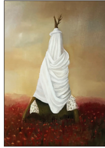
Elian Zinner ohne Titel, 2020 Öl auf Leinwand 80 x 70 cm CHF 1.500