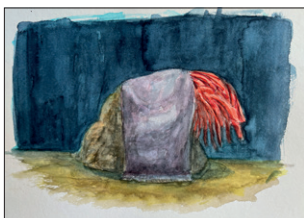
Elian Zinner ohne Titel, 2022 Aquarell auf Papier 25 x 30 cm CHF 300