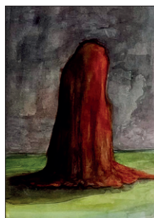
Elian Zinner ohne Titel, 2022 Aquarell auf Papier 30 x 25 cm CHF 300