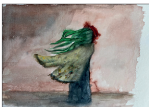
Elian Zinner ohne Titel, 2022 Aquarell auf Papier 25 x 30 cm CHF 300