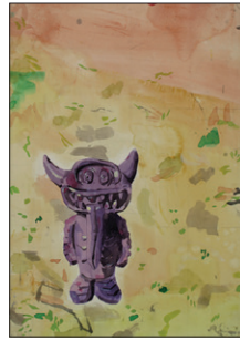
Tom Fellner Monster Drawing 23 (Purple Demon), 2011 Bleistift/Wasserfarbe/Gouache auf Papier 67 x 46 cm CHF 3.000 (gerahmt)