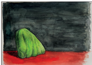
Elian Zinner ohne Titel, 2022 Aquarell auf Papier 25 x 30 cm CHF 300