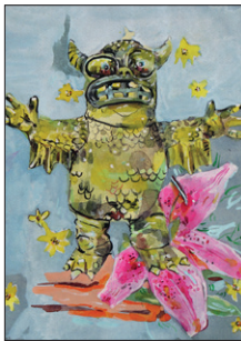
Tom Fellner Monster Drawing 102 (Greasebat/Hippie Monster) 2013 Bleistift/Wasserfarbe/Gouache auf farbigem Papier 27 x 21,5 cm CHF 1.900 (gerahmt)