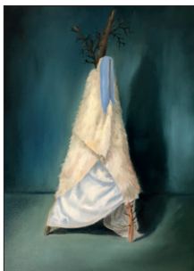
Elian Zinner ohne Titel, 2020 Öl auf Leinwand 80 x 70 cm CHF 1.500