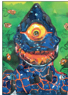
Tom Fellner Monster Drawing 28 (Blue One Eye), 2011 Bleistift/Wasserfarbe/Gouache auf Papier 34 x 27 cm CHF 1.800 (gerahmt)