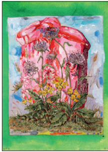
Tom Fellner Monster Drawing 95 (Little Asshole in the Garden) 2013 Bleistift/Wasserfarbe/Gouache auf gefundener Zeichnung 23,5 x 17,5 cm CHF 1.600 (gerahmt)