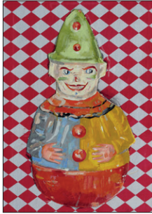
Tom Fellner Clown 1, 2015 Acryl/Tempera/Öl auf bedrucktem Stoff 65 x 55 cm CHF 3.800