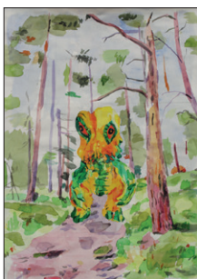
Tom Fellner Monster Drawing 1, 2010 Bleistift/Wasserfarbe auf Papier 63 x 48 cm CHF 2.800 (gerahmt)