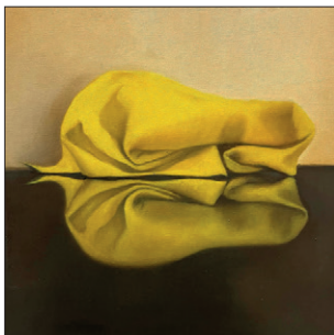
Elian Zinner Putzlappen III, 2019 Öl auf Leinwand 50 x 50 cm CHF 800