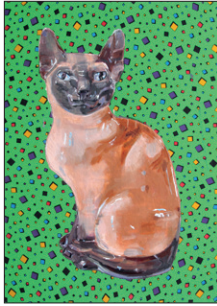
Tom Fellner Katze 1, 2016 Acryl/Tempera/Öl auf bedrucktem Stoff 100 x 80 cm CHF 5.000