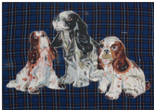
Tom Fellner Drei Hunde, 2016 Acryl/Tempera/Öl auf bedrucktem Stoff 75 x 100 cm CHF 5.000