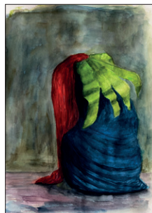
Elian Zinner ohne Titel, 2022 Aquarell auf Papier 56 x 47 cm CHF 500