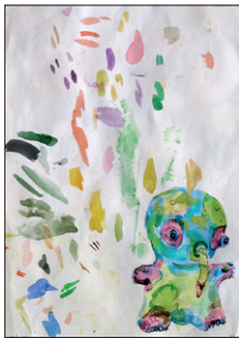
Tom Fellner Monster Drawing 101 (Baby Monster), 2013 Bleistift/Wasserfarbe/Gouache auf Papier 27 x 19 cm CHF 1.900 (gerahmt)