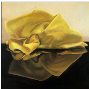
Elian Zinner Putzlappen II, 2019 Öl auf Leinwand 50 x 50 cm CHF 800