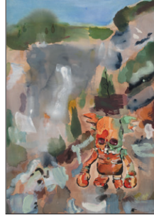
Tom Fellner Monster Drawing 22 (The Boxer), 2011 Bleistift/Wasserfarbe/Gouache auf Papier 73 x 53 cm CHF 3.000 (gerahmt)