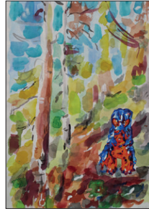
Tom Fellner Monster Drawing 2, 2010 Bleistift/Wasserfarbe/Gouache auf Papier 57 x 30 cm CHF 2.500 (gerahmt)