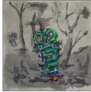
Tom Fellner Monster Drawing 139 (The Mad Caterpillar), 2020 Bleistift/Wasserfarbe/ Gouache/Tinte auf Papier 18 x 19 cm CHF 1.400 (gerahmt)