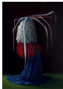
Elian Zinner ohne Titel, 2022 Öl auf Leinwand 75 x 60 cm CHF 1.500