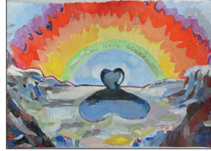
Tom Fellner Das Herz bleibt 1, 2021 Bleistift/Wasserfarbe/ Gouache/Tusche auf Papier 25 x 36 cm CHF 2.200 (gerahmt)