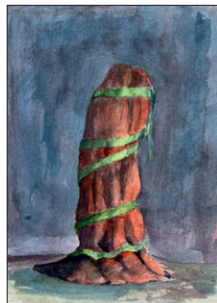
Elian Zinner ohne Titel, 2022 Aquarell auf Papier 30 x 25 cm CHF 300