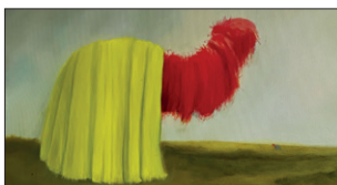
Elian Zinner Wischiwuschis, 2021 Öl auf Leinwand 30 x 60 cm CHF 800