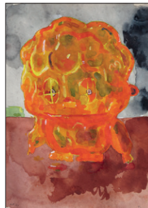
Tom Fellner Monster Drawing 27 (Lost Boy 2), 2011 Bleistift/Wasserfarbe/Gouache auf Papier 34 x 25 cm CHF 1.800 (gerahmt)